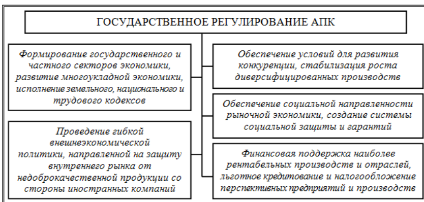
Рисунок 2 - Основные направления государственного регулирования аграрного сектора АПК

дарственный характер, а для ее достижения необходимы совместные усилия значительного количества